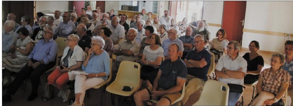
Une conférence qui a passionnée l'ensemble des sociétaires de la Société des sciences de Semur-en-Auxois.

« Le choix de ce petit village n'est pas anodin puisque la tuile-