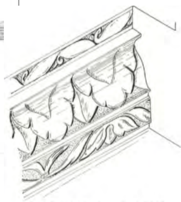
Fig. 5 : Restitution d'un claveau décoré - Ech 1/5 Dessin M. Ribolet.